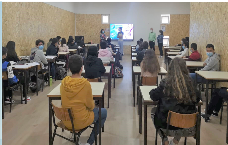
Escola secundária de Vagos